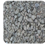
UG 0-22 mm