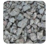
UG 0-45 mm