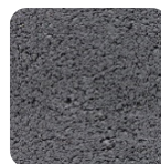
anthrazit als Markierfarbe