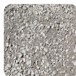
UG 0–45 mm