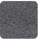
anthrazit als Musterfarbe