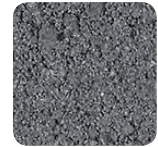
anthrazit als Markierfarbe